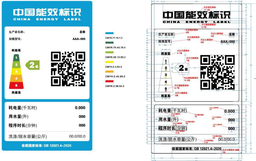
图 1 洗衣机能效标识样式示例