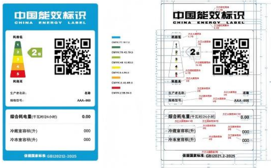
图 1 电机驱动压缩式电冰箱能效标识样式示例

2.3 标识样式示例见图 1、图 2，可从“中国能效标识网”（ www.energylabel.com.cn ）下载。