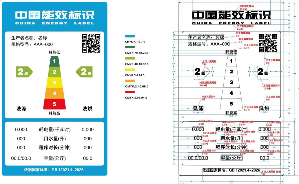
图 2 洗干一体机能效标识样式示例

注：多筒（桶）式产品中容量相同、其他参数不同的筒（桶）在规格型号后标注该筒（桶）的位置。