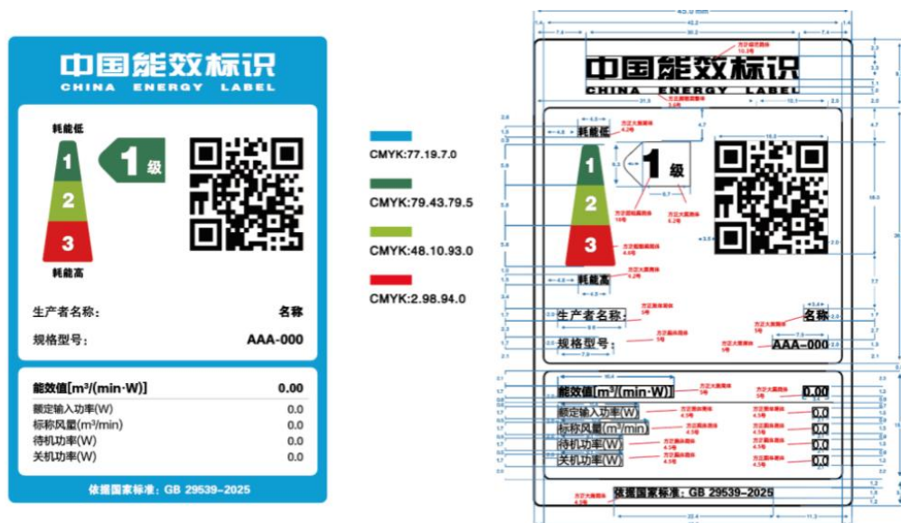
图 2 换气扇能效标识样式示例