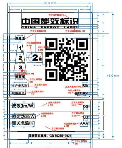
图 1 室内照明用 LED 产品能效标识样式示例