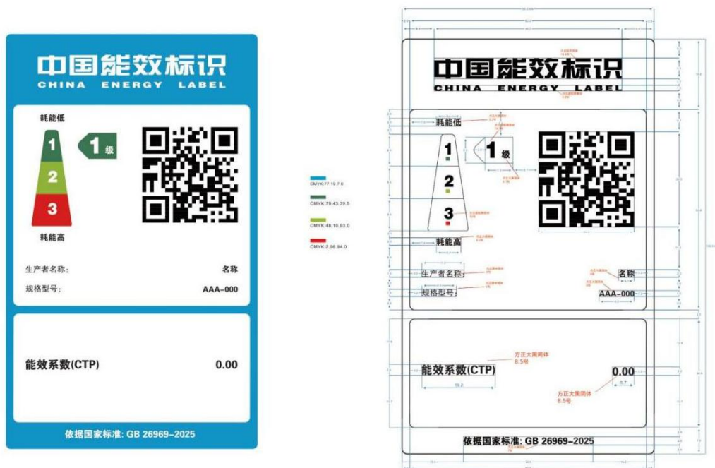
图 1 家用太阳能热水系统能效标识样式示例