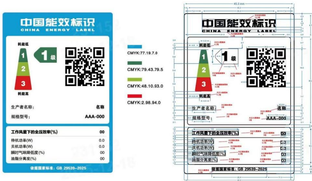
图 1 吸油烟机能效标识样式示例

2.3 标识样式示例见图 1、图 2。可从“中国能效标识网” ( www.energylabel.com.cn ) 下载。