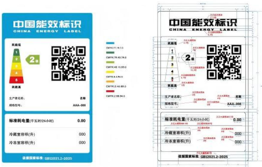
图 2 半导体制冷电冰箱能效标识样式示例