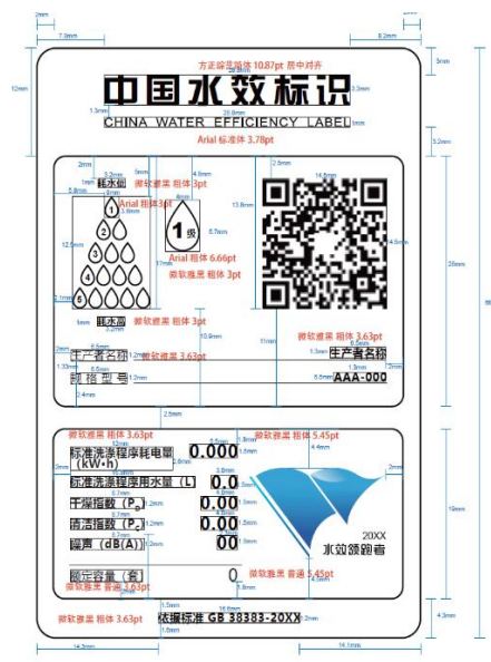
图 2 洗碗机含领跑者信息的标识样式示例