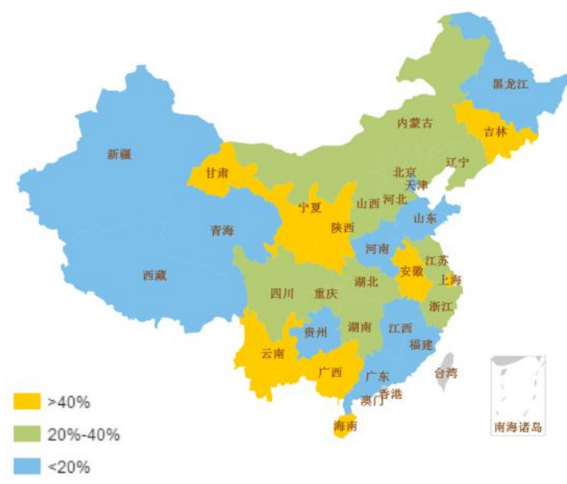
图2 新增拟建投资项目转化率情况

2018年1—6月份，新增拟建投资项目数量转化率前十位的地区为云南、广西、上海、甘肃、海南、宁夏、安徽、陕西、吉林、浙江。